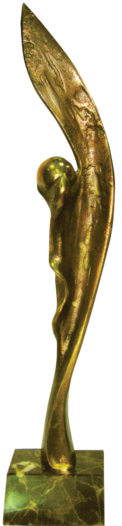
I miejsce - złota Perla Eskulapa w IV edycji Ogólnopolskiego konkursu PERŁY MEDYCYNY