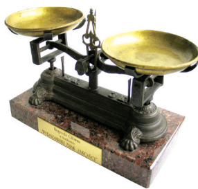
WAGA Warszawskiego Znaku Jakości 2009- nagroda główna